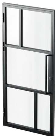
Antaba z pochwytem i zamkiem

z zamkiem i wkładką. Klamkę można zastąpić stalową, pionową antabą (do wyboru wersja z zamkiem baryłkowym lub bez zamka). Drzwi posiadają stalowe, spawane, łożyskowane zawiasy gwarantujące ich płynną pracę.