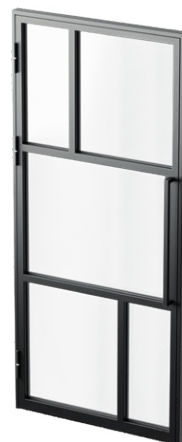
Antaba z pochwytem bez zamka